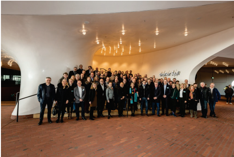
Die Teilnehmer des Events „Heinze Select“ am 9. und 10. März 2017 in der Hamburger Elbphilharmonie