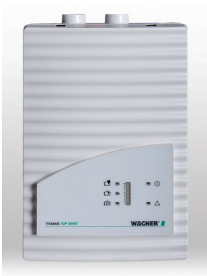
Insgesamt 67 Ansaugrauchmelder des Typs TITANUS TOP-SENS ® wurden in der Hamburger Elbphilharmonie verbaut